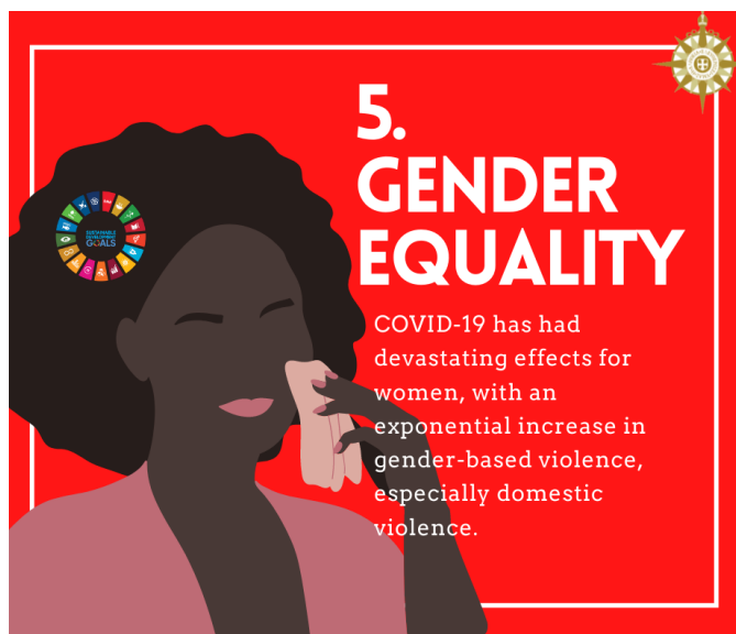
ACOUN Campaña en el Twitter

En junio, la Oficina del Alto Comisionado de las Naciones Unidas para los Derechos Humanos (OACDH) hizo un llamamiento a todas las organizaciones, estados y personas para informar sobre el aumento de los abusos domésticos presenciados en todo el mundo debido a la pandemia de COVID-19. Países como Francia, la Argentina y Singapur han comunicado un aumento del 30% en las denuncias de violencia en el hogar desde el comienzo del encierro, ya que las mujeres se ven cada vez más obligadas a ponerse en cuarentena con sus agresores.